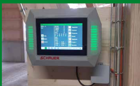
Intuitive Bedienung mit dem Cow Guard