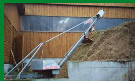
Hydro-Förderer für grosse Mistmengen