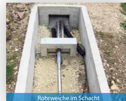
Rohrweiche im Schacht