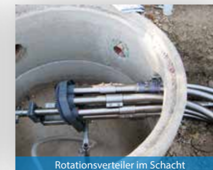
Rotationsverteiler im Schacht